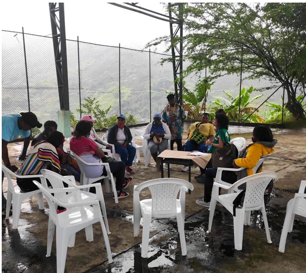
Imagen 1 Taller de participación de mujeres. Consejo Comunitario Las Brisas, Suárez, Cauca.

En el caso de Las Brisas, la participación de las mujeres en los espacios de asamblea fue alto, y al menos 15 de ellas hicieron parte del taller específico. Inicialmente, identificaron que la brecha de participación aún existe – aunque en menor medida – porque persisten los estigmas alrededor de las capacidades de liderazgo, toma de decisiones de las mujeres y porque su participación continúa condicionada por las labores de reproducción que les impiden participar en otras esferas. Sin embargo, insistieron en que al interior del consejo se está haciendo un esfuerzo significativo, liderado por las mismas mujeres del consejo, para disminuir la brecha de oportunidades de participación política que existe entre hombres y mujeres. Hoy, las mujeres de Las Brisas participan a través de los distintos comités de la Junta (comité de salud, recreación etc.) y recientemente, se eligió a una mujer joven como representante legal del consejo comunitario.