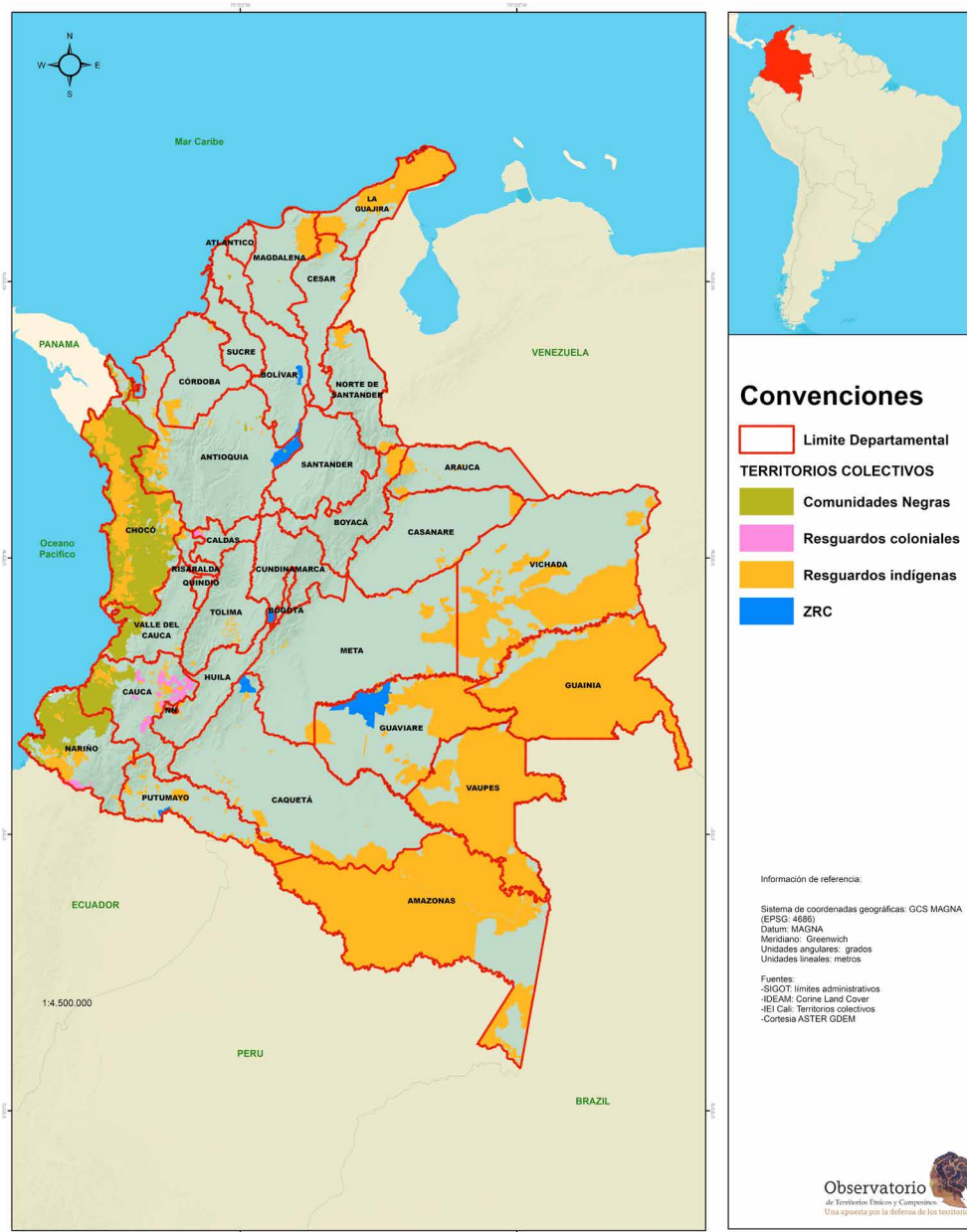
Mapa 1. Localización de territorios colectivos y zonas de reserva campesina (ZRC) en Colombia.

Fuentes: Sistemas de Información Geográfica del Instituto Geográfico Agustín Codazzi, Instituto de Estudios Interculturales (Pontificia Universidad Javeriana – Cali) y OTEC (Pontificia Universidad Javeriana –Bogotá). Compilado por Elías Helo.